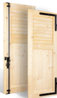
VOLETS BATTANTS 32mm À LAMES JOINTIVES AU TIERS EN BOIS EN SAVOIR PLUS