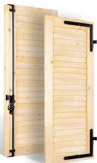
VOLETS BATTANTS 32mm À LAMES JOINTIVES EN BOIS EN SAVOIR PLUS