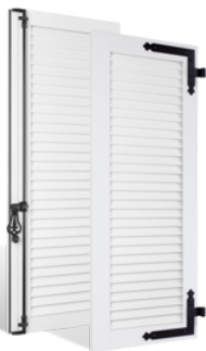
VOLETS BATTANTS 36mm À LAMES JOINTIVES EN PVC EN SAVOIR PLUS