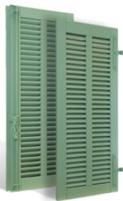
VOLETS BATTANTS MENTON À LAMES À L'AMÉRICAIN EN BOIS EN SAVOIR PLUS