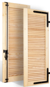
VOLETS BATTANTS 32 mm À LAMES À L'AMÉRICAIN EN BOIS EN SAVOIR PLUS