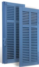
VOLETS BATTANTS CANNES À LAMES À L'AMÉRICAIN EN BOIS EN SAVOIR PLUS