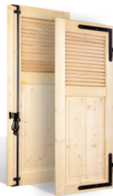
VOLETS BATTANTS 32 mm À LAMES À L'AMÉRICAIN AU TIERS EN BOIS EN SAVOIR PLUS