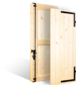
VOLETS BATTANTS 59mm DAUPHINOIS EN BOIS