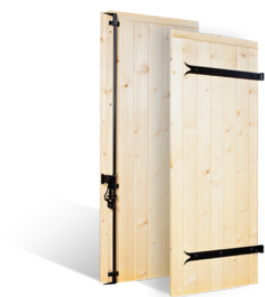
VOLETS BATTANTS 32mm À CLÉS EN BOIS