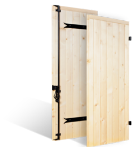
VOLETS BATTANTS 32mm GARDOIS EN BOIS