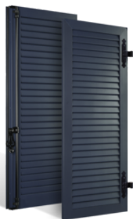
VOLETS BATTANTS 33mm À LAMES JOINTIVES EN ALUMINIUM EN SAVOIR PLUS