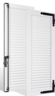
VOLETS BATTANTS 36mm À LAMES JOINTIVES EN PVC EN SAVOIR PLUS