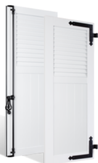
VOLETS BATTANTS 36mm À LAMES JOINTIVES AU TIERS EN PVC EN SAVOIR PLUS