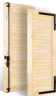
VOLETS BATTANTS 32mm À LAMES JOINTIVES EN BOIS EN SAVOIR PLUS