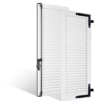
VOLETS BATTANTS 36mm À LAMES JOINTIVES EN PVC EN SAVOIR PLUS