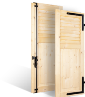
VOLETS BATTANTS 32mm À LAMES JOINTIVES AU TIERS EN BOIS EN SAVOIR PLUS