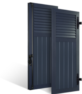
VOLETS BATTANTS 33mm À LAMES JOINTIVES AU TIERS EN ALUMINIUM EN SAVOIR PLUS