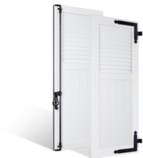
VOLETS BATTANTS 36mm À LAMES JOINTIVES AU TIERS EN PVC EN SAVOIR PLUS