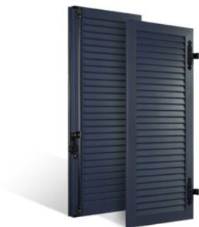
VOLETS BATTANTS 33mm À LAMES JOINTIVES EN ALUMINIUM EN SAVOIR PLUS