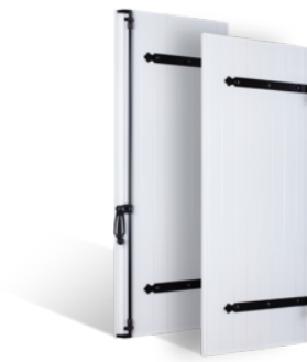
VOLETS BATTANTS 27mm À PENTURES ET CONTRE-PENTURES EN PVC EN SAVOIR PLUS