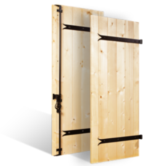
VOLETS BATTANTS 27mm À PENTURES ET CONTRE-PENTURES EN BOIS EN SAVOIR PLUS