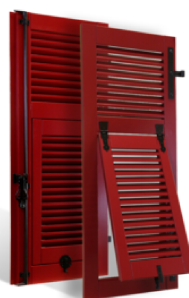
VOLETS BATTANTS NIÇOIS À LAMES À LA FRANÇAISE EN BOIS