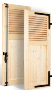
VOLETS BATTANTS 32mm À LAMES À LA FRANÇAISE AU TIERS EN BOIS