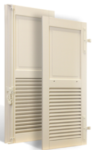
VOLETS BATTANTS GRASSE À LAMES À LA FRANÇAISE EN BOIS