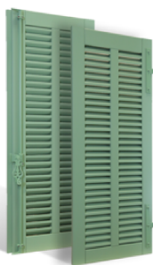
VOLETS BATTANTS MENTON À LAMES À LA FRANÇAISE EN BOIS