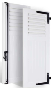
VOLETS BATTANTS 36mm À LAMES À LA FRANÇAISE AU TIERS EN PVC