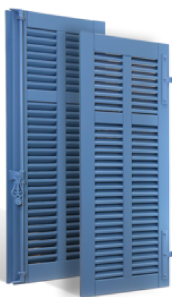
VOLETS BATTANTS CANNES À LAMES À LA FRANÇAISE EN BOIS