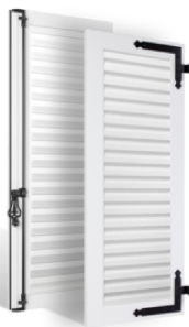
VOLETS BATTANTS 36mm À LAMES À LA FRANÇAISE EN PVC