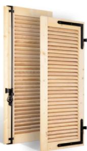
VOLETS BATTANTS 32mm À LAMES À LA FRANÇAISE EN BOIS