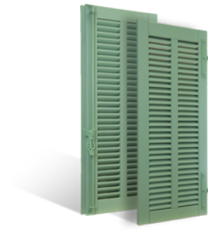
VOLETS BATTANTS MENTON À LAMES À LA FRANÇAISE EN BOIS EN SAVOIR PLUS