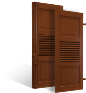
VOLETS BATTANTS COLMAR À LAMES À LA FRANÇAISE EN BOIS EN SAVOIR PLUS