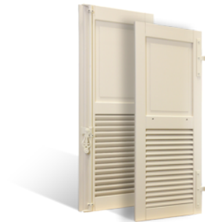
VOLETS BATTANTS GRASSE À LAMES À LA FRANÇAISE EN BOIS EN SAVOIR PLUS