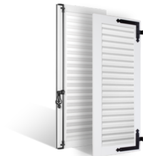
VOLETS BATTANTS 36mm À LAMES À LA FRANÇAISE EN PVC EN SAVOIR PLUS