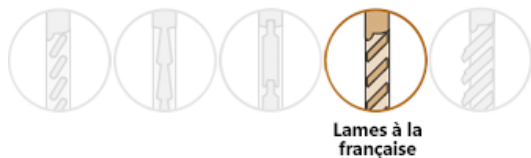
Lames à la française

Fabriqué en France en sapin du nord certifié PEFC en mélèze ou en bois exotique, aux dimensions standard ou sur mesure, et livrable au choix en bois brut ou finition traité IFH, impression blanche (sur IFH), laque couleur, lasure ton bois.