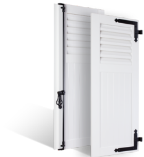
VOLETS BATTANTS 36mm À LAMES À LA FRANÇAISE AU TIERS EN PVC EN SAVOIR PLUS