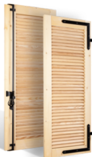
VOLETS BATTANTS 32mm À LAMES À L'AMÉRICAIN EN BOIS EN SAVOIR PLUS