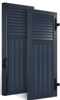
VOLETS BATTANTS 33mm À LAMES À L'AMÉRICAIN AU TIERS EN ALUMINIUM EN SAVOIR PLUS