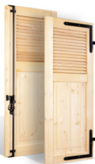
VOLETS BATTANTS 32mm À LAMES À L'AMÉRICAIN AU TIERS EN BOIS EN SAVOIR PLUS