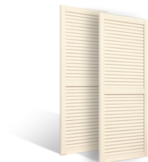
VOLETS COULISSANTS 32mm LAMES JOINTIVES EN BOIS EN SAVOIR PLUS