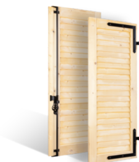
VOLETS BATTANTS 32mm À LAMES JOINTIVES EN BOIS EN SAVOIR PLUS