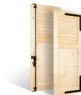
VOLETS BATTANTS 32mm À LAMES JOINTIVES AU TIERS EN BOIS EN SAVOIR PLUS