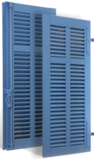
VOLETS BATTANTS CANNES À LAMES À LA FRANÇAISE EN BOIS EN SAVOIR PLUS