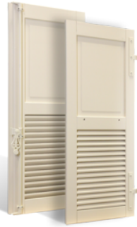
VOLETS BATTANTS GRASSE À LAMES À LA FRANÇAISE EN BOIS EN SAVOIR PLUS