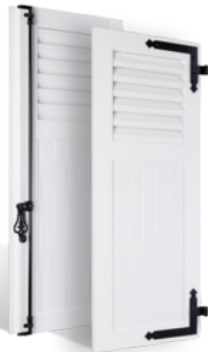
VOLETS BATTANTS 36mm À LAMES À LA FRANÇAISE AU TIERS EN PVC EN SAVOIR PLUS