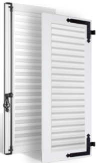
VOLETS BATTANTS 36mm À LAMES À LA FRANÇAISE EN PVC EN SAVOIR PLUS