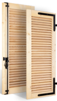
VOLETS BATTANTS 32mm À LAMES À LA FRANÇAISE EN BOIS EN SAVOIR PLUS