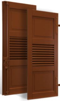
VOLETS BATTANTS COLMAR À LAMES À LA FRANÇAISE EN BOIS EN SAVOIR PLUS