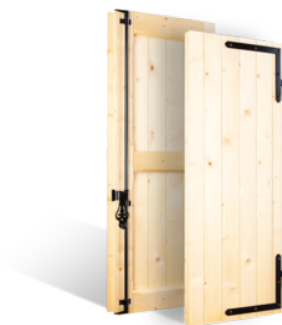
VOLETS BATTANTS 59mm DAUPHINOIS EN BOIS EN SAVOIR PLUS