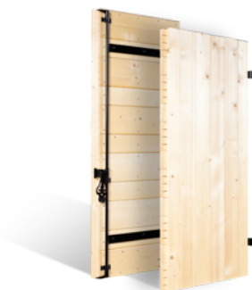
VOLETS BATTANTS 52mm PROVENÇAL EN BOIS EN SAVOIR PLUS